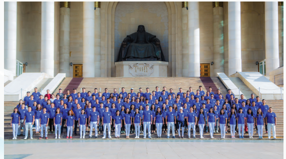
Бэрс Финанс ББСБ-ийн хамт олон

Бэрс Финанс ББСБ нь 2017 онд үүсгэн байгуулагдсан, Улаанбаатар хотод 2 салбар, орон нутагт 18 аймагт 19 салбар, нийт 21 салбартайгаар харилцагчдад санхүүгийн үйлчилгээг хүссэн газраасаа авах боломжийг бүрдүүлсэн Монголын хамгийн өргөн дэд бүтэцтэй, хүртээмжтэй, хурдацтай өсөн тэлж буй банк бус санхүүгийн байгууллага юм. 2021 онд 5.1 тэрбум төгрөгийн цэвэр ашигтай ажиллаж, 2022 оны эхний хагас жилийн байдлаар 56 тэрбум төгрөгийн хөрөнгөтэй, 47 тэрбум төгрөгийн зээлийн багцтай болж, 7.4 тэрбум төгрөгийн хүүгийн орлоготой ажилласан байна.