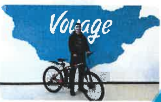
5196 аэтан тодруулав