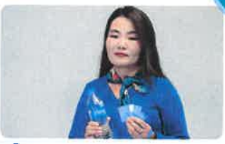
2 өрөө байрны аэтан