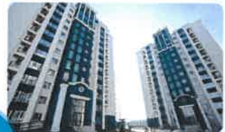
2 аэтан 2 өрөө байр