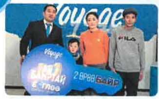
2 өрөө байрны аэтан