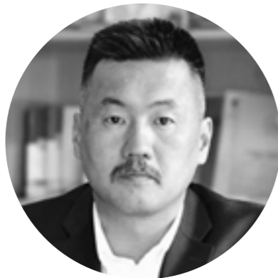
Мөнх-Очирын Сэргэлэн (Ерөнхийлөгч, Техник Технологийн ДС)