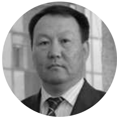
Чулууны Мөнхбат (Ерөнхийлөгч, Саусгоби сэндс)