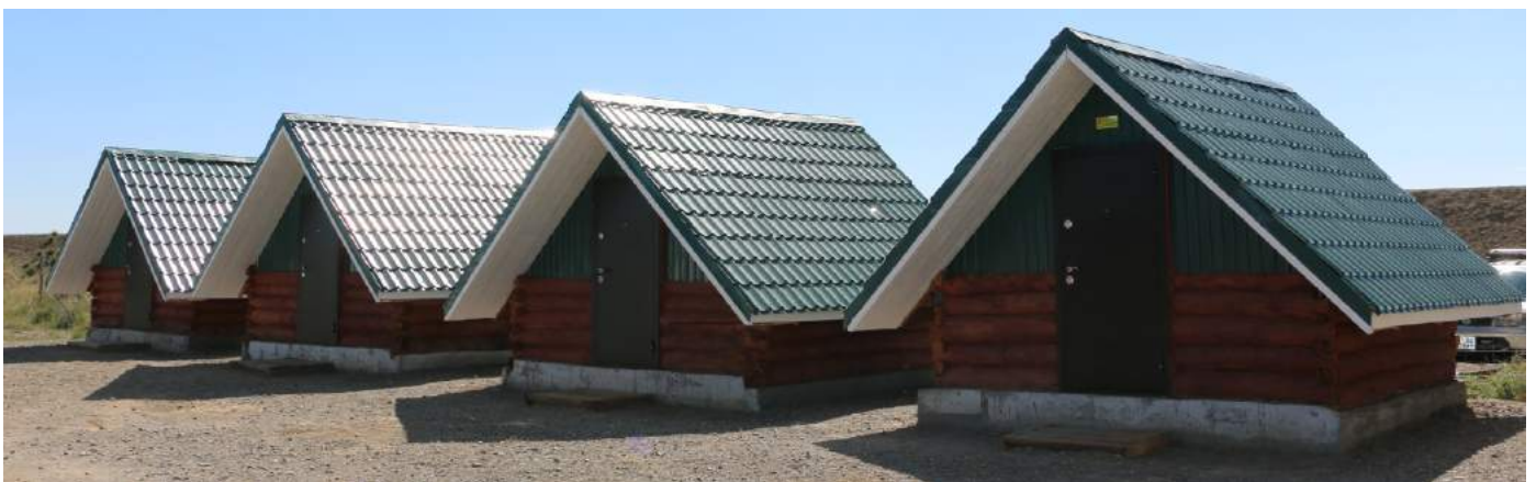
Эрэгтэй, эмэгтэй ажилчдын амрах, хувцас солих байр