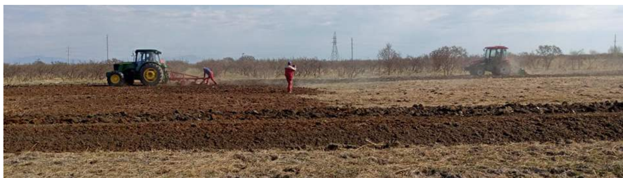
6,5 га газар боловсруулж, тариалалт хийсэн