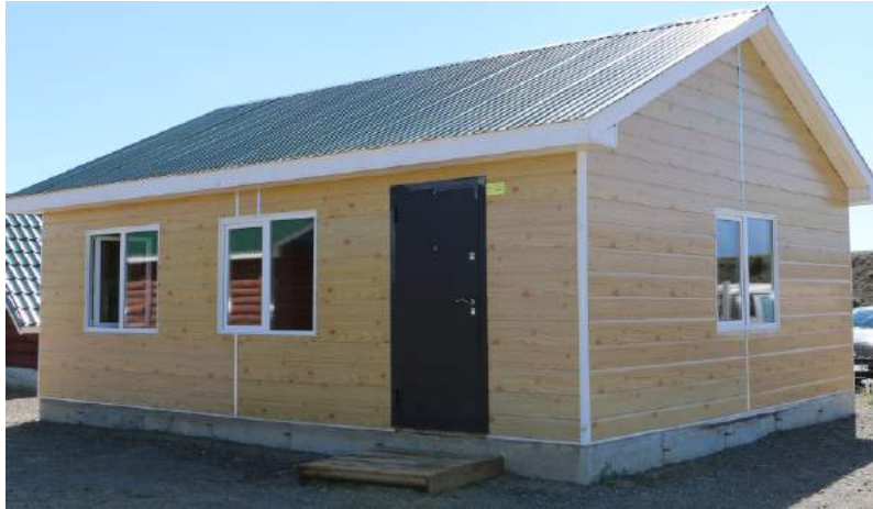
Чацарганы аж ахуйн офисийн байр