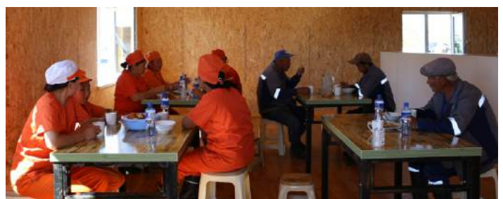
Чацарганы аж ахуйн хоолны газар