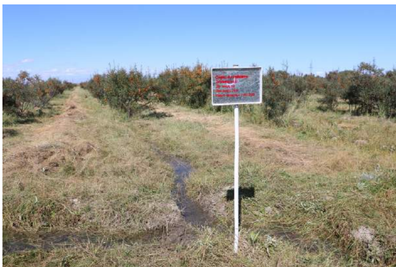
Талбайн тэмдэг тэмдэглэгээг шинэчилсэн