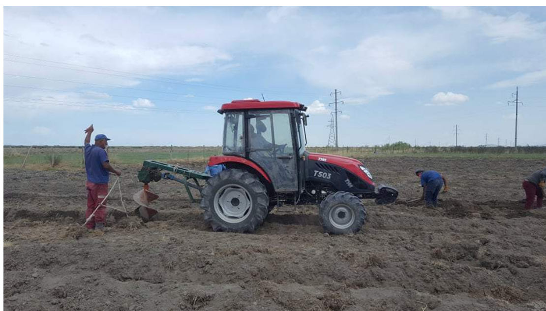
6,334 ширхэг мод тарив