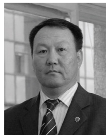
Чулуун МӨНХБАТ Ерөнхийлөгч, Саусгоби сэндс