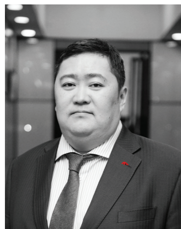
Пүрэвжаргал БАТБАЯР ТУЗ-ийн дарга, Ард Санхүүгийн Нэгдэл