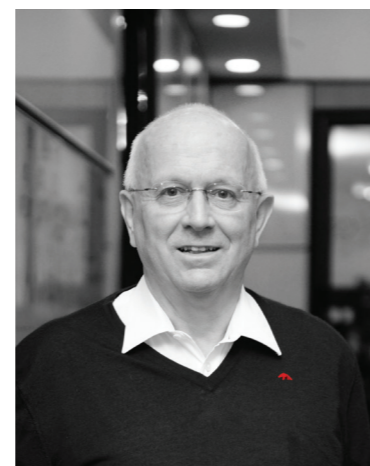
БРУНО Рашле Дэд дарга, Шродер Адвек